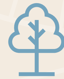
גינה בכל דירה

כיור עם ארון אינטרפוף 4 דרך אמבטיה אקרילית שירותי אורחים חיבור חשמל 3x25 *פירוט ונתונים סופיים ע"פ המוזכר לעיל יפורטו ויצויינו במפרט המכר.