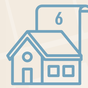
6 דירות בכל דגם